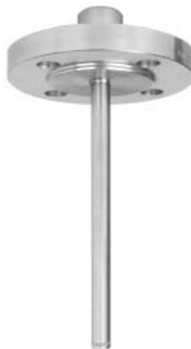
Защитная гильза с фланцем Модель SW550F